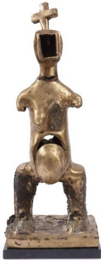
Nelson Carrilho | Congo Blues | 2019

Van de beeldhouwer Nelson Carrilho (1953) werd het werk Congo Blues (2019) aangekocht, een beeld gemodelleerd naar een West-Afrikaans voorouderbeeld maar verminkt en vastgenageld. Het verbeeldt de vervreemding van de eigen cultuur die zwarte Afrikanen ondergingen toen zij naar het Caraïbisch gebied werden verscheept. Het kruis op het hoofd verbeeldt de rol van de kerk hierin.