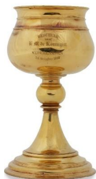
fa. J.M. van Kempen en Zonen | Avondmaalskelk | 1885 | Voorschoten | Lutherse gemeente Maastricht

In 2023 werd een aantal bijzondere stukken aan de collectie toegevoegd. Het Luther Museum is een logische partij voor de herbestemming van belangrijk erfgoed uit lutherse kerken. Van de Lutherse Gemeente Zuid-Nederland ontvingen we een belangrijk bruikleen - voorheen bewaard in de schatkamer van de Sint Servaas Basiliek in Maastricht. Daaronder bevindt zich onder andere bijzonder avondmaalsgerei zoals een avondmaalskelk die in 1884 door koningin Emma aan de lutherse gemeente in Maastricht is geschonken.