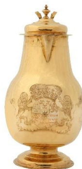
Paul Solanier of Philipp Saller | Avondmaalskan | 1694 | Augsburg | Lutherse gemeente Vaals

Uit de Lutherse kerk te Purmerend - die vanwege verkoop moest worden leeggeruimd - zijn elf voorwerpen in bruikleen overgenomen, waaronder het enige voorbeeld van luthers avondmaalsgerei in rococostijl.