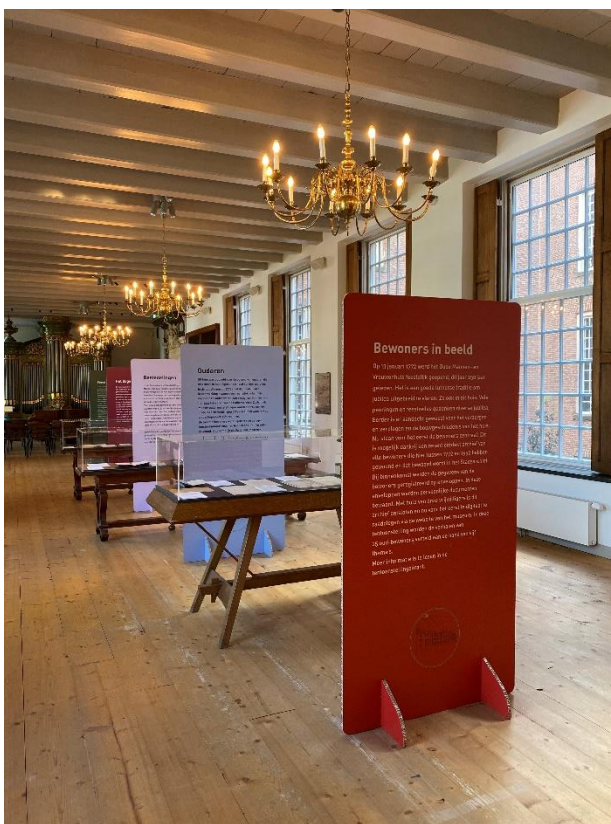
Tentoonstelling Bewoners in Beeld