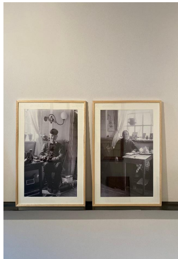
Bewoners uit de tentoonstelling Bewoners in Beeld