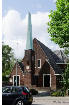
(Nieuwerdammerdijk 72 – 74)

In 1928 gebouwd (architect: Ingwersen), tot 1946 in gebruik bij de Gereformeerde Kerken in Hersteld Verband. Van 1953 tot de sluiting in 2015 in gebruik bij de Lutheranen. Het gebouw en het bijgebouw werd verkocht en functioneert sinds 2018 als kantoor en centraal cateringsbedrijf. (zie ook de gemeente Amstelveen)